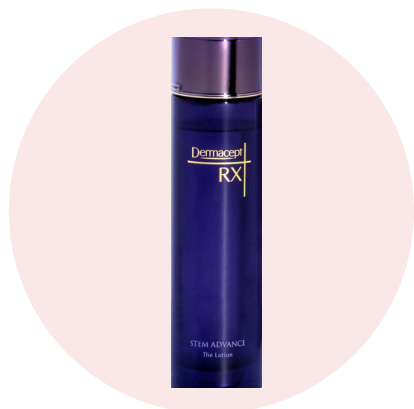
ステムアドバンスローション (化粧水) 150ml 13,200円