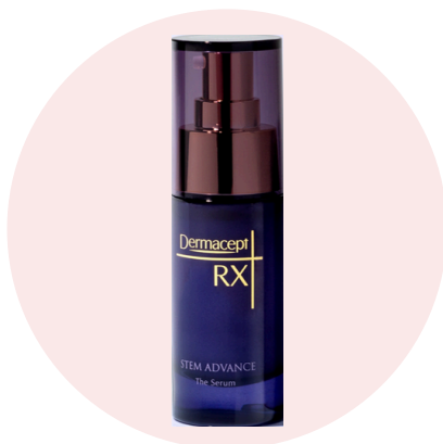
ステムアドバンスセラム (セラム) 30ml 38,500円