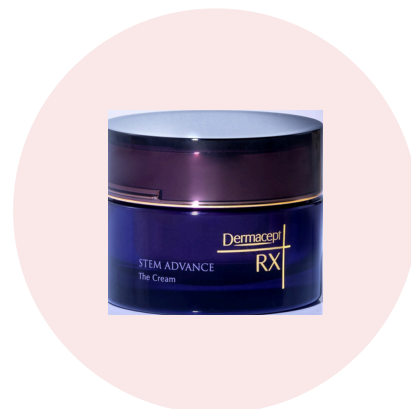
ステムアドバンスクリーム (クリーム) 50g 46,200円